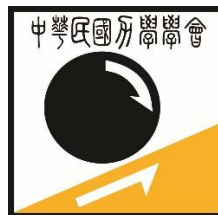
圖 1. 中華民國力學學會。